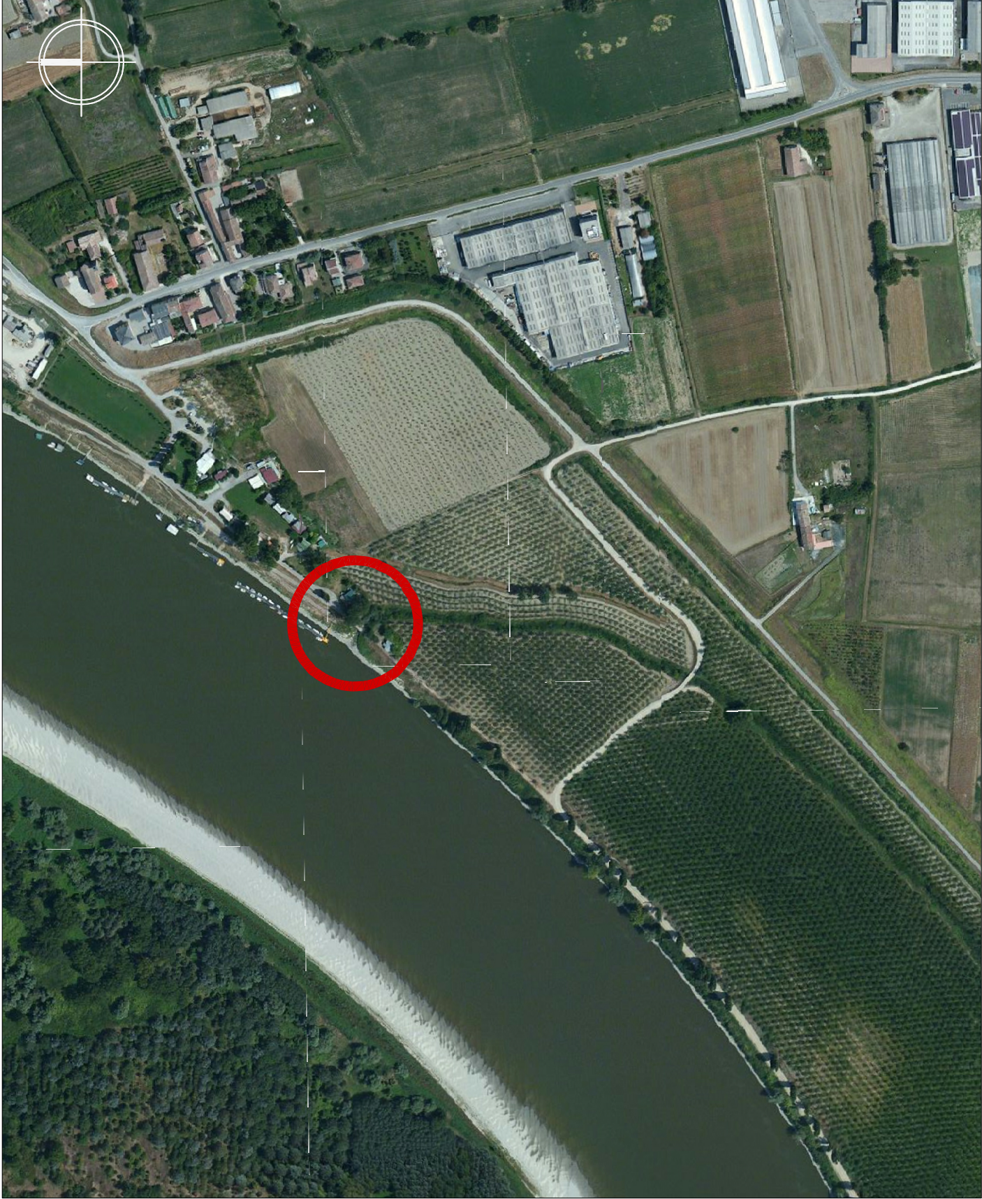
03 - Inquadramento su Ortofoto